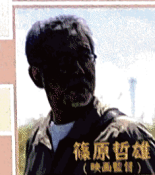
篠原哲雄 (映画監督)